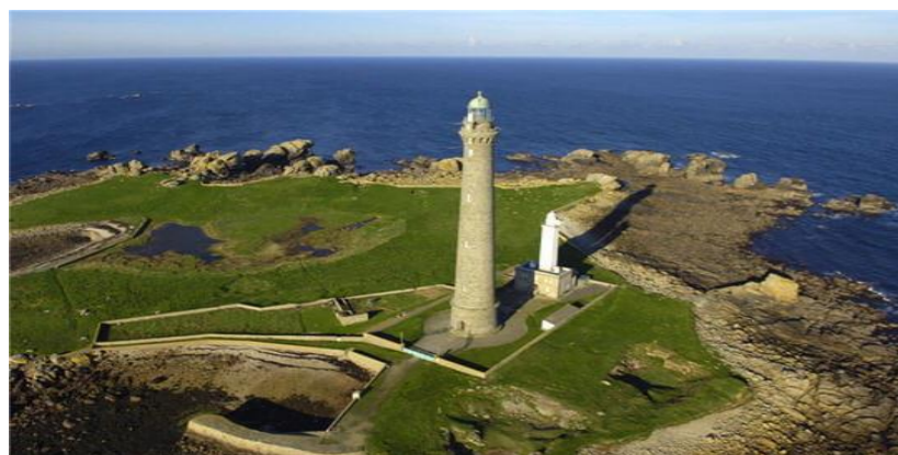
Phare de l'île Vierge

L'équipe de cuisine du collège Alain vous propose le